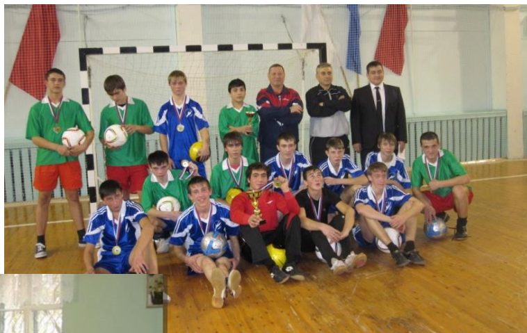
«С ветром наперегонки», соревнования по футболу, декабрь 2013 года