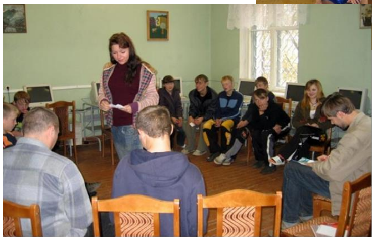
«Умей сказать «Нет», тренинг, октябрь 2014 года