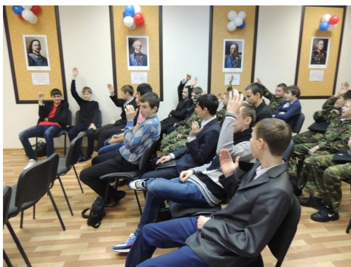
«Права и обязанности подростка», правовая игра, октябрь 2014 года